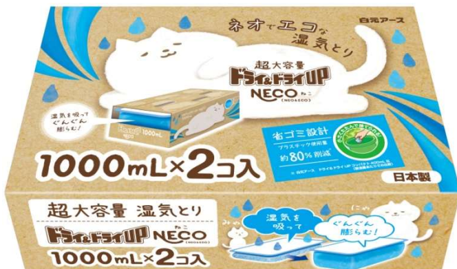
ドライ&ドライUP NECO 1000mL