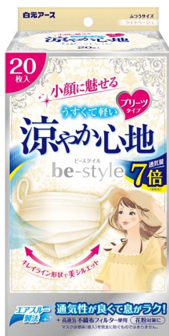
ビースタイル プリーツタイプ 涼やか心地 ライトベージュ 20枚入