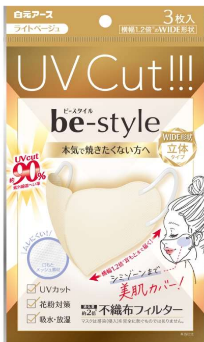
ビースタイル UVカットマスク ライトベージュ3枚入