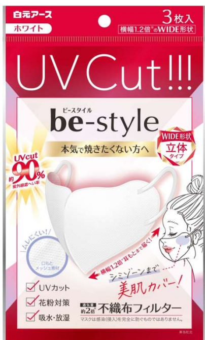
ビースタイル UVカットマスク ホワイト3枚入