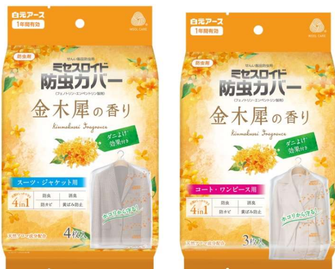
ミセスロイド防虫カバー 金木犀の香り スーツ・ジャケット用 / コート・ワンピース用

白元アースは人気の香りのラインナップを充実させて市場のさらなる活性化を目指してまいります。※屋内塵性ダニに対する効果