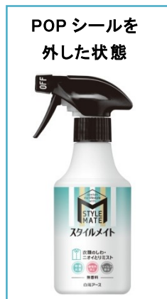
スタイルメイト 衣類のしわ・ニオイとりミスト 無香料