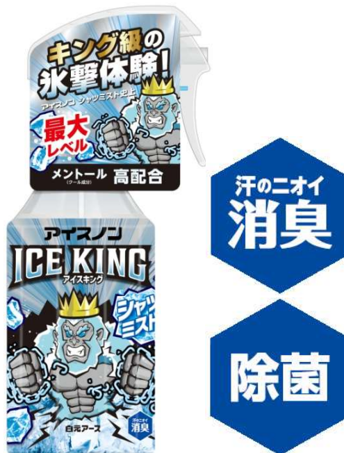
アイスノン シャツミスト ICE KING