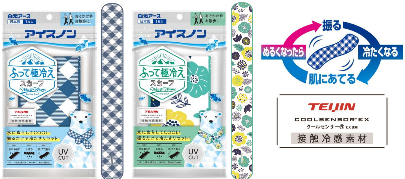
アイスノン ふって極冷えスカーフ ネイビーチェック / ノルディックフラワー

白元アース株式会社（本社：東京都 台東区、社長：吉村一人）は、水にぬらして振って使う冷感スカーフ『アイスノン ふって極冷えスカーフ ネイビーチェック／ノルディックフラワー』を3月10日より新発売いたします。