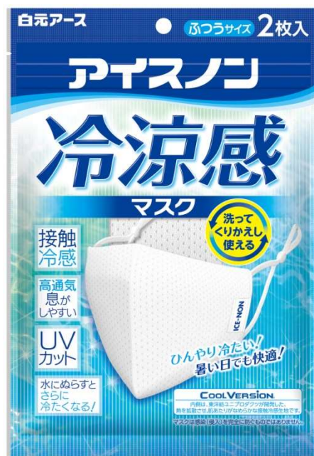
アイスノン 冷涼感マスク 2枚入