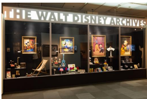
ウォルト・ディズニー・アーカイブスのロビーにある 巨大なショーケースを再現

米国ウォルト・ディズニー・アーカイブスのロビーにあるショーケースを再現。ショーケース内部に飾られたミッキーマウスの記念ポートレートや、時代ごとに生み出された貴重なグッズをご覧いただきながら、今年スクリーンデビュー90周年を迎えるミッキーマウスの歴史を辿ることができます。