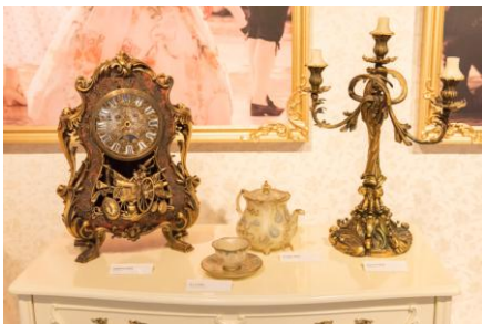
『美女と野獣』 ダンスシーンに実際に使用された美しい衣裳と、表情に注目のキャラクター・モデル

『アリス・イン・ワンダーランド/時間の旅』、『パイレーツ・オブ・カリビアン/最後の海賊』の両作品からは、ジョニー・デップがこだわりぬいたという衣裳や小道具を展示。