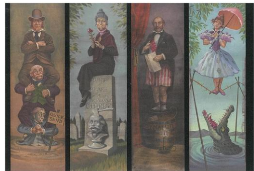
「伸びる肖像画の部屋」に登場する4枚の絵