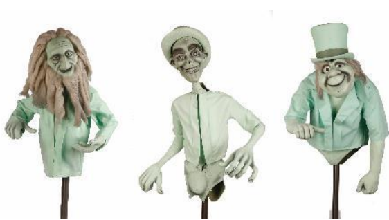
「ホーンテッド・マンション」 有名なヒッチ・ハイクする3体のゴースト

フロリダ ウォルト・ディズニー・ワールド・リゾートの人気アトラクション「ホーンテッド・マンション」のコーナーでは、実際に使用された3体のゴーストも登場するほか、アトラクションの制作風景の舞台裏を紹介するショート・ムービーも注目を集めています。