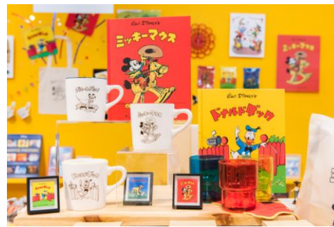
東京会場の展覧会グッズ販売コーナー