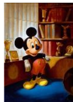
ジョン・ヘンチ画 ミッキーマウスの最初のポートレート（1928年）

この他にもディズニーと日本の深い絆を紹介する展示など、盛りだくさんの展示内容となっています。