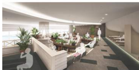
<アタミリビング内 クリフラウンジ イメージ>