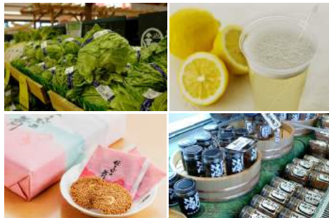
<取り扱い商品イメージ>