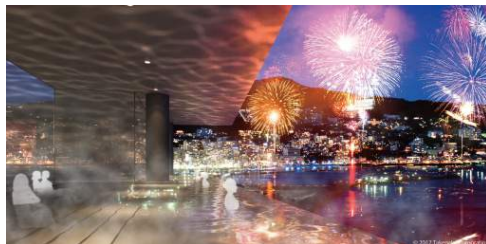
<露天立ち湯 イメージ>