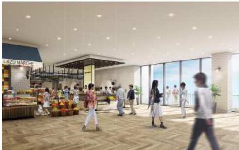
<ラ・伊豆 マルシェ イメージ>