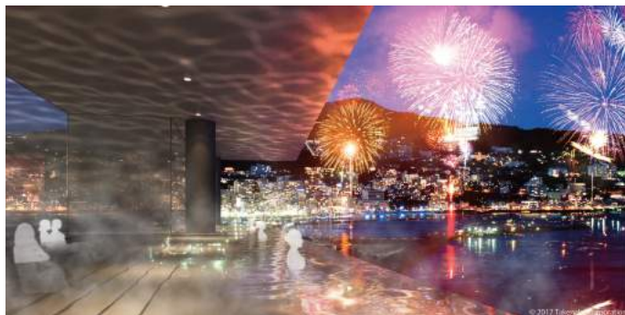
<オーシャンスパ Fuua イメージ>

「ATAMI BAY RESORT KORAKUEN」は、宿泊施設「熱海後樂園ホテル」に加え、熱海最大級の日帰り温泉施設「オーシャンスパ Fuua（フーア）」、海辺のロケーションで伊豆の食材を楽しめるレストラン「HARBOR'S W（ハーバース ダブル）」と、伊豆周辺の「美味しい食」と出会うことができる食のマーケット「ラ・伊豆 マルシェ」などが集まる「IZU-ICHI（イズイチ）」を展開し、日帰りでも楽しめる新しい街として生まれ変わります。