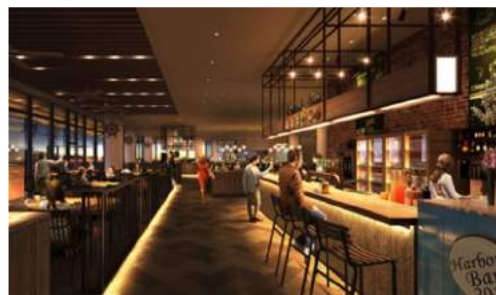
<アラカルトエリア イメージ（夜）>