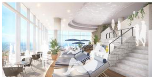
<アタミリビング内 オーシャンラウンジ イメージ (昼) >