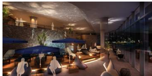
<アタミリビング内 オーシャンラウンジ イメージ (夜) >