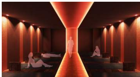
<岩盤浴Laava (ラーヴァ) イメージ>