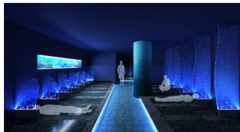
<岩盤浴Meressä (メレッサ) イメージ>