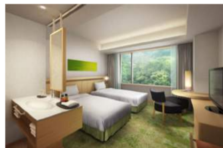
<コートヤードツイン イメージ>