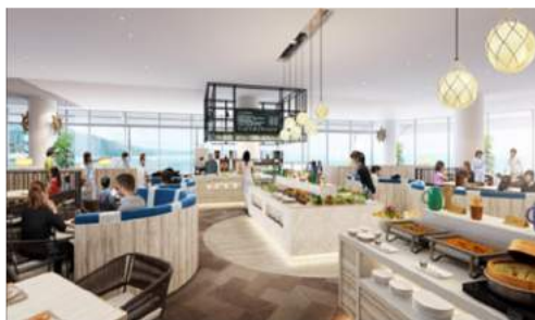
<ブッフェエリア イメージ（昼）>