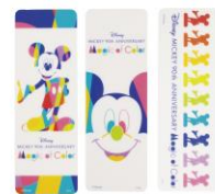
クリアしおり(各 194 円)