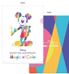
A4 クリアファイル(378 円)