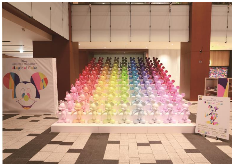
「ディズニー ミッキー90周年 マジック オブ カラー」キービジュアル/会場写真

モノクロ映画からカラー映画へと表現の方法は大幅な進化を遂げ、ミッキーの世界に色は欠かせないものとなりました。本イベントでは「色が作り出す魔法がここに」をコンセプトに、ミッキーと色の持つ多様性を鮮やかに彩られた世界で表現いたします。会場では、ミッキー90周年関連商品を約500種類販売するスペシャルポップアップショップや、会場を鮮やかに彩る90色・90体のミッキーマウス立像、メルセデス生まれのシティ・コンパクト「smart」の特別仕様車等 ※ の展示を展開いたします。また、イベントを実施する施設ごとにテーマカラーを設け、テーマカラーに合わせたノベルティグッズのプレゼントキャンペーンも実施いたします。一部商品は、三井ショッピングパーク公式ファッション通販サイト「Mitsui Shopping Park & mall (アンドモール)」でもご購入頂けます。