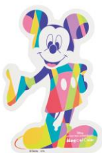
マグネットシート A3(2,970 円)