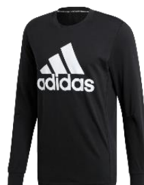
ロングスリーブ T シャツ (9505575010)