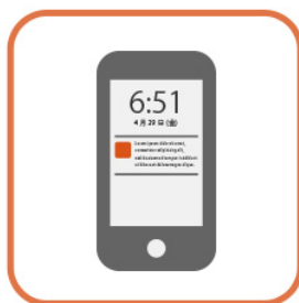
アプリのプッシュ通知