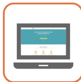
WEBサイトの会員ページ