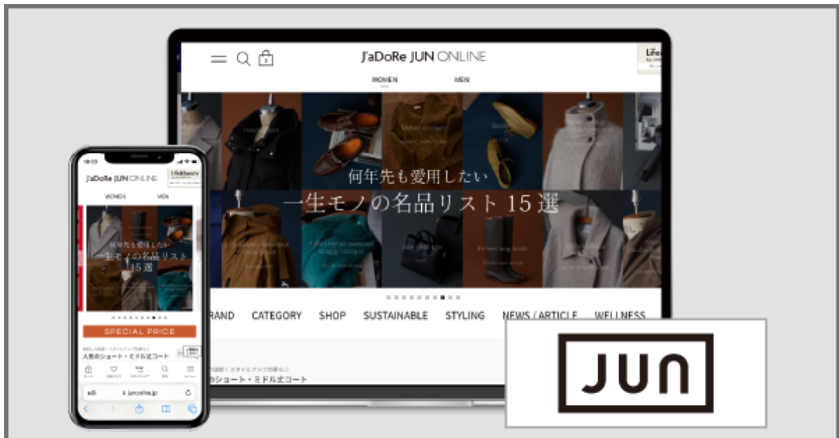
【ジュンが運営する公式通販サイト『J'aDoRe JUN ONLINE』】

EC商品検索・レビュー・ハッシュタグ・ECキュレーション・OMOソリューションを開発販売するコマースとCXのリーディングカンパニーであるZETA株式会社(本社：東京都世田谷区、以下ZETA)は、株式会社ジュン(本社：東京都港区、以下ジュン)が運営する公式通販サイト『J'aDoRe JUN ONLINE』にて、レビュー・口コミ・Q&A エンジン「ZETA VOICE」が導入されたことをお知らせいたします。