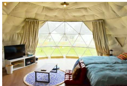
ドームテント/和洋室 (2~4 名)