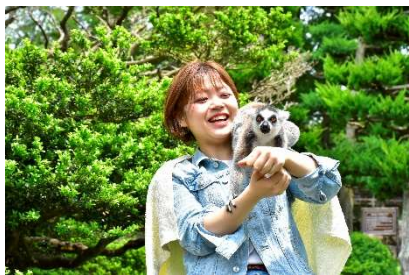
車で5分！「伊豆シャボテン動物公園」

1500種類の世界のサボテンや多肉植物と、約140種類の動物たちに出会える。国内でここだけの「アニマルポートツアーズ」、「カピバラ虹の広場」など距離感ゼロでふれあい体験が楽しめる。