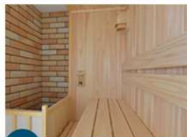
NEW フィンランド式サウナ ロウリュウタイプ