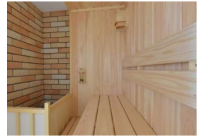
フィンランド式サウナロウリュタイプ(1~4 名)

・椅子、テーブル、ベッド、エアコン、テレビ、冷蔵庫、空気清浄機、Bluetooth スピーカー、ルームウェア、スリッパ、外履き、セーフティボックス、室外用ランタン