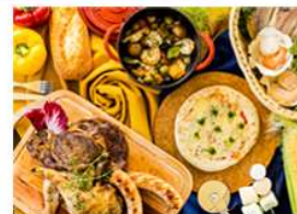
シェフ特製 アウトドアディナー

伊豆シャボテン動物公園グループに、グランピング施設「伊豆グランヴィレッジ」( https://id-village.jp/granvillage )が、2022年7月10日(日)オフィシャルホテルとしてニューオープンいたします。