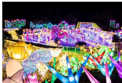
「伊豆高原グランイルミ」が目の前

新アトラクション「エアパルーン」、実物大の動く恐竜たちの間をゴーカートで駆け抜ける「ディノエイジカート」、カラフルな巨大ボール、キッズアスレチックやボルダリングなど、キッズ用の無料遊具が充実♪