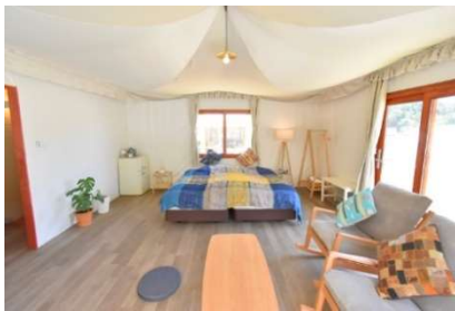
スクエアテント/洋室 (2~4 名)