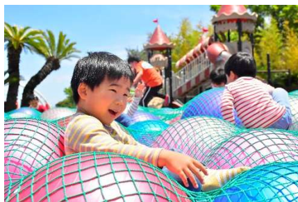
「伊豆ぐらんぱる公園」が目の前

1500種類の世界のサボテンや多肉植物と、約140種類の動物たちに出会える。国内でここだけの「アニマルポートツアーズ」、「カピバラ虹の広場」など距離感ゼロでふれあい体験が楽しめる。