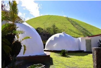
徒歩 0 分！「大室山」

1500 種類の世界のサボテンや多肉植物と、約 140 種類の動物たちに出会える。国内でここだけの「アニマルポートツアーズ」、「カピバラ虹の広場」など距離感ゼロでふれあい体験が楽しめる。