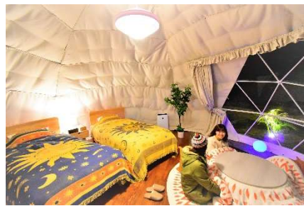
和洋室タイプ (2~5 名)