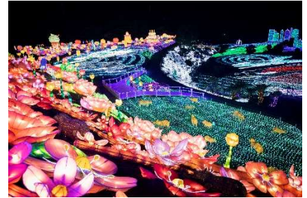
車で 3 分「伊豆高原グランイルミ」

約 4000 年前の噴火で誕生した「大室山」は、国の天然記念物であり、伊豆高原最大のパワースポットでもある。毎年 2 月上旬に行われる「山焼き」は春を告げる風物詩となっている。