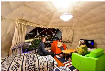
洋室タイプ (2~5 名)