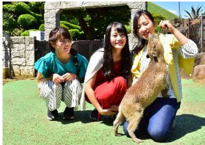
徒歩 0 分！「伊豆シャボテン動物公園」

1500 種類の世界のサボテンや多肉植物と、約 140 種類の動物たちに出会える。国内でここだけの「アニマルポートツアーズ」、「カピバラ虹の広場」など距離感ゼロでふれあい体験が楽しめる。