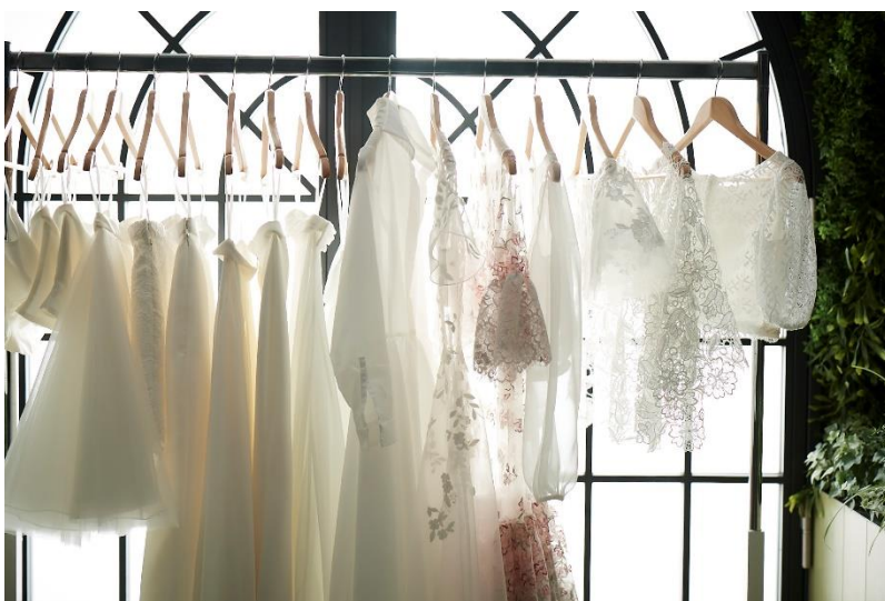
<クローゼットスタイル イメージ >