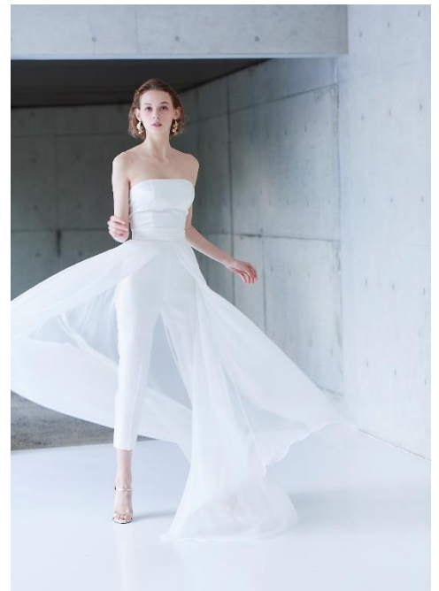
<クローゼットスタイル ウエディングドレス>