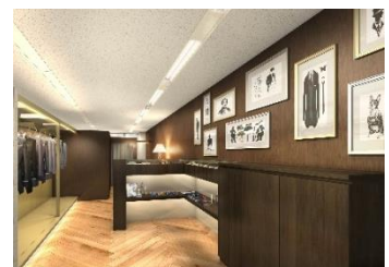
&lt;メンズフロア完成予想図&gt;