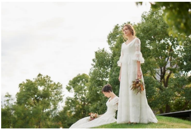
<ウエディングドレス>

ウエディングドレス 販売 20万（税抜）～ ※販売のみの取扱い タキシード 販売 15万（税抜）～ / レンタル 10万（税抜）～