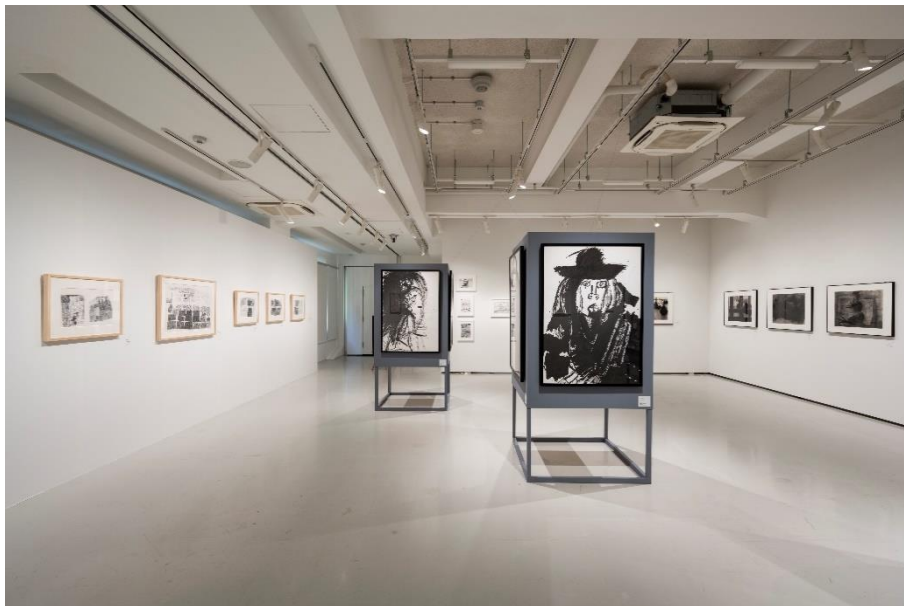
展覧会「モノクローム えが 描くこと」展示風景

東京都渋谷公園通りギャラリーは、2023 年 7 月 22 日（土）、「モノクローム えが 描くこと」展を開幕いたしました。9 月 24 日（日）までの会期中、2 つの展示室で、平面および立体作品・計 67 点の展示と制作の様子を記録した映像の上映に加え、 アーティストや学芸員のギャラリートークなど関連イベント を開催いたします。7 名の作家が魅せる、限られた色の世界に広がる、限りのない表現を、ぜひお楽しみください。