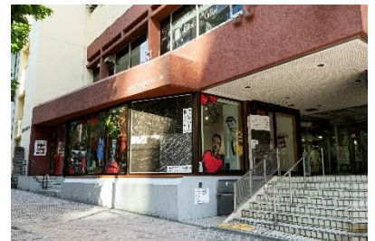
東京都渋谷公園通りギャラリー外観