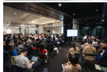
「アート&テクノロジーへの問い」開催風景

※本シリーズは、CCBTにおいて国内外の研究者等をパートナーとし、シビック・クリエイティブの実現に資するための研究、開発とその公開を推進する「リサーチ・パートナー・プログラム」の一環として実施しています。