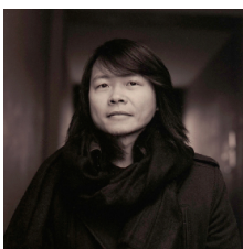
ユク・ホイ (Yuk Hui) [香港] 哲学者

ユク・ホイ氏は、話題の著書『中国における技術への問い—宇宙技芸試論』などを通じ、「アジアに哲学はあるのか？」という問いに立ち向かい、技術概念の多様化をめざし「宇宙技芸」を提唱する哲学者です。一方のジョンソン・チャン氏は、国際的美術のプラットフォームへの適合とは異なる方法で、中国の美術の形成を牽引してきたキュレーター／教育者です。本シンポジウムでは、「アジアにアートはあるのか？」という問いから、アート&テクノロジーが導くアジアにおける文化芸術の新たなコンテキストを考えていきます。