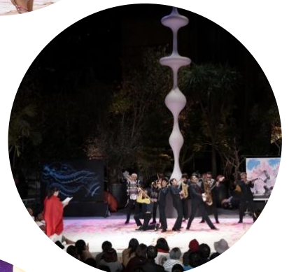
東京キャラバン in 六本木(2016年)