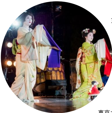
東京キャラバン in 京都(2017年)