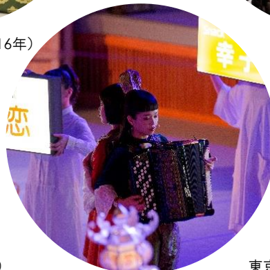
東京キャラバン in 秋田(2018年)

本リリースに関するメディアお問い合わせ先 東京キャラバン広報事務局 担当：岩川・銭谷 TEL: 03-6826-8708 Email: press@tokyocaravan.jp