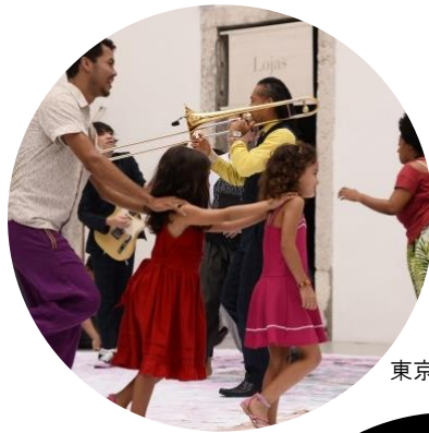
東京キャラバン in RIO(2016年)