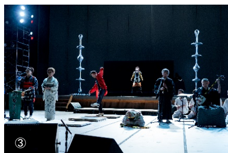
「東京キャラバン in 秋田」 ①秋田県内（男鹿市）視察の様子（2018年）、② 公開ワークショップ（2018年）③ パフォーマンス（2019年）