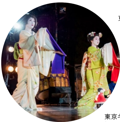
東京キャラバン in 京都(2017年)