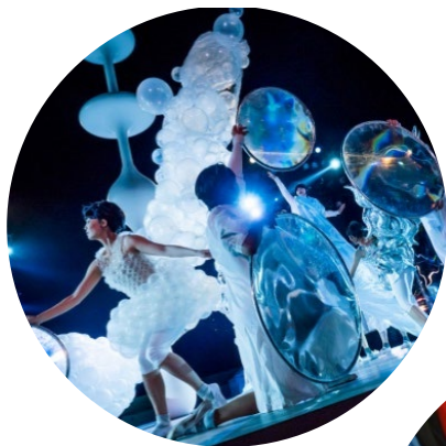
東京キャラバン～プロローグ～(2015年)