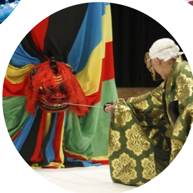
東京キャラバン in 東北(2016年)