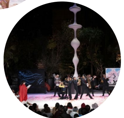
東京キャラバン in 六本木(2016年)