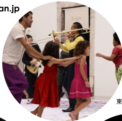
東京キャラバン in RIO(2016年)