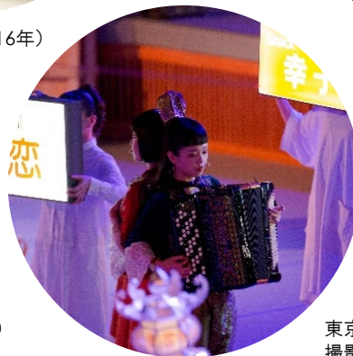
東京キャラバン in 秋田(2018年)

本リリースに関するメディアお問い合わせ先 東京キャラバン広報事務局 担当：銭谷・大山 TEL: 03-6826-8708 Email: press@tokyocaravan.jp