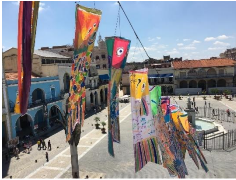
TURN in HAVANA