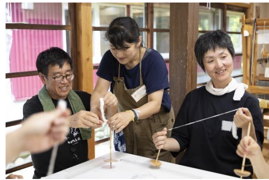
TURN LAND (クラフト工房 La Mano)