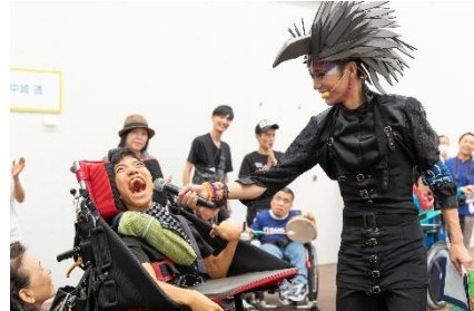
「TURN フェス 4」(2018 年)の様子