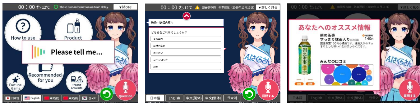
※各 AI 画面は開発中のものにつき、変更となる場合がございます。

※カメラにて取得した画像情報は個人に特定できないデータに即時変換し、個人を特定するデータは即時破棄され、保持しません。