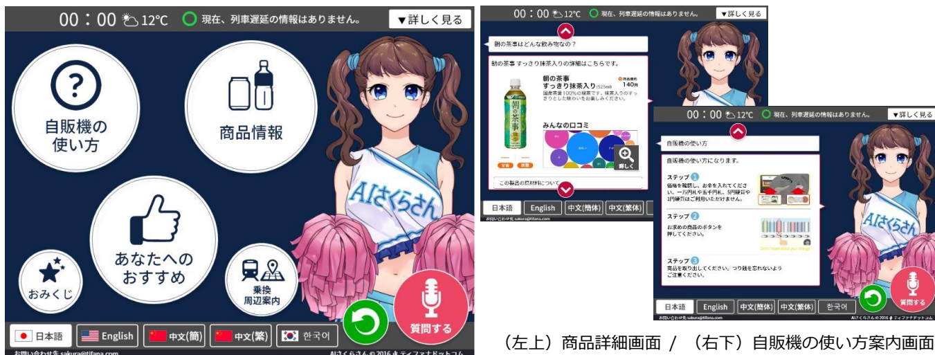
(左上) 商品詳細画面 / (右下) 自販機の使い方案内画面

自販機正面に 15 インチのタッチパネルを搭載。「AI さくらさん」のバーチャルアニメーションを表示します。お客さまのタッチパネル操作や口頭での質問に対して、AI を活用して様々な案内を行います。