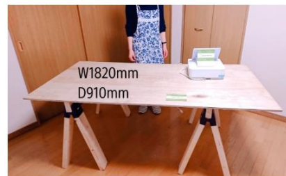
通常テーブル（無料）