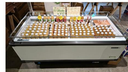
冷蔵/冷凍ショーケース（有料）

ご希望に応じて、通常テーブルの代わりに「冷蔵/冷凍ショーケース」もお貸出し可能です。（1台：2,160円（税込）/日） ※通常テーブルとの併用はできません。その場合は2ブースレンタルとなります。