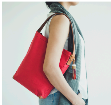
ワンマイルトート 7,800円(税込8,424円)

2017年のブランド誕生から3年目を迎え、従来のアースカラーのラインナップに加え、南国カンボジアと爽やかな息吹をイメージしてカラーバリエーションを増やしました。また、昨年から人気商品であるカンボジアの風景を切り取ったハンカチは、4種類から全15種類となり、カンボジアの美しい空、色鮮やかな南国の花、のどかな農村風景、世界遺産であるアンコールワットをはじめとしたカンボジアの歴史を象徴する遺跡など多様なパターンをご用意しております。