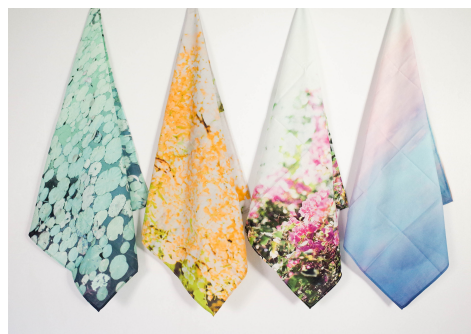
SALASUSUハンカチ 1,800円(税込1,944円)

<2019年SALASUSU「カンボジアの香り感じる」POP UP SHOP第1弾>