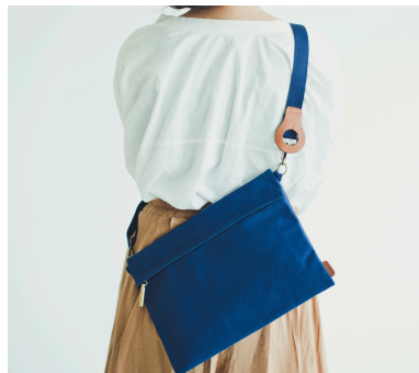
トラベルサコッシュ 4,500円(税込4,860円)