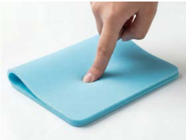
超柔軟・極ふわの肌触り