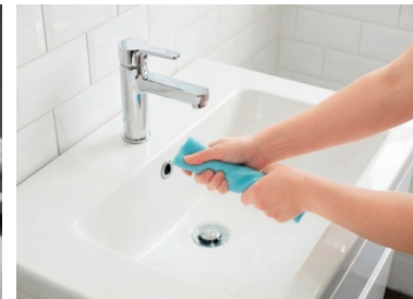
絞りやすさと優れた排水性