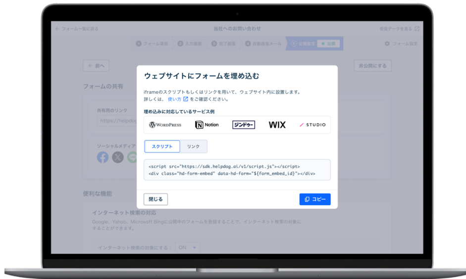
iframe フォーム埋め込み機能

noco 株式会社提供のフォーム作成管理システム「ヘルプドッグ フォーム」は、WordPress（ワードプレス）、STUDIO、Zindou、Wix、Notion などで作成したウェブサイトにも、iframe を使用してヘルプドッグ フォームで作成したフォームを設置することができる「iframe フォーム埋め込み機能」の提供を開始したことをお知らせします。