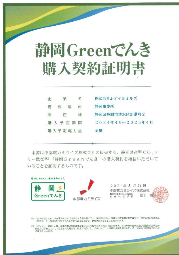
「静岡 Green でんき」購入契約証明書