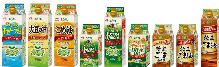
「スマートグリーンパック®」シリーズ

「スマートグリーンパック®」シリーズは、プラスチック廃棄物や CO 2 排出量の削減を推し進めるため、紙パック（森林認証紙）を容器に採用し、包装機能と環境対応を追求したシリーズです。家庭用製品は 2021 年 8 月に 2 製品を販売開始し、2022 年春にシリーズ化、その後もラインアップの充実を図っています。