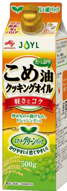
JOYL「AJINOMOTO こめ油たっぷりクッキングオイル」500g スマートグリーンパック®