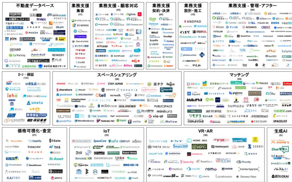
第10版：2024年8月（499）不動産クラウドファンディング含む