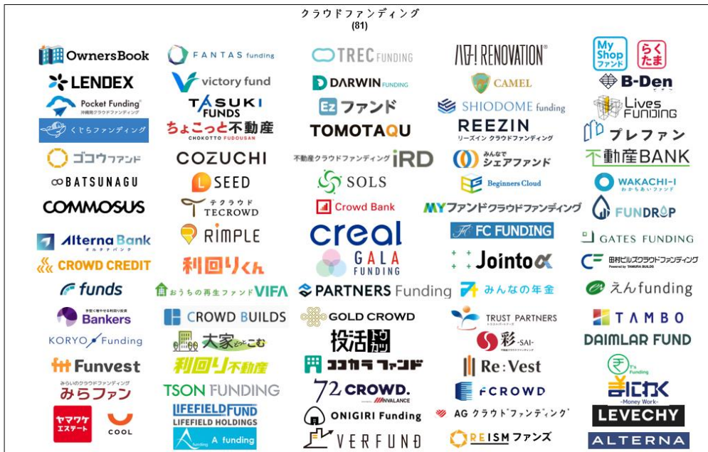
第10版：2024年8月（81サービス）