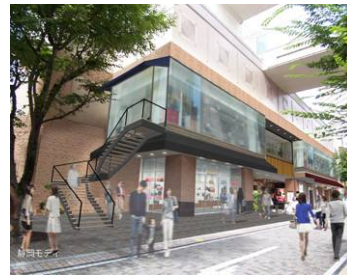
静岡モディ 1F 店頭(イメージ)