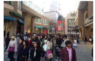
マルイが位置するけやき通り

このようなエリアに、当社グループではこの度新たに、「マルイ」「モディ」という2つのストアブランドを展開することで、多様化するお客さまニーズにお応えし、さらに、これまで以上に地元の皆さまとの連携を深め、静岡エリアの魅力アップに貢献してまいります。