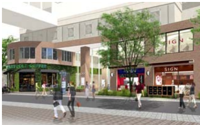
静岡マルイ 1F 店頭(イメージ)

マルイグループは、1969年のオープン以来、多くのお客さまにご利用いただいております「丸井静岡店」を全館リニューアル。旧A館を「静岡マルイ」、旧B館を新たな商業施設「静岡モディ」として11月19日（土）にオープンいたします。