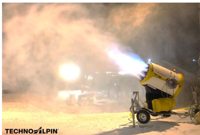
最新スノーマシン追加導入でより早期に安定した積雪量を確保します