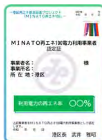
認定証のイメージ

再エネ電力を導入した事業者には、申請に応じて、区が「MINATO再エネ100電力利用事業者」として認定し、認定証を交付するとともに、港区ホームページにおいて公表し、その取組を広く周知します。