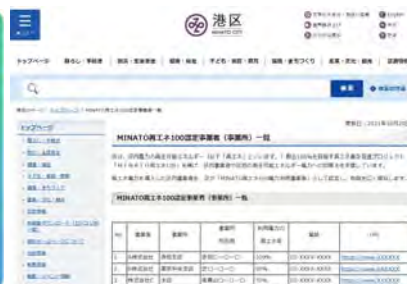
港区ホームページのイメージ