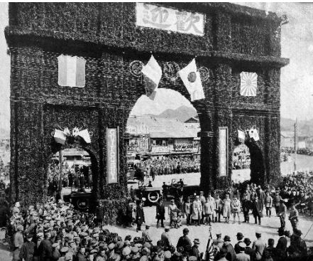
▲岐阜駅前の凱旋門風アーチ ↳フランス航空教育団歓迎の様子

100 年前に来日し、飛行機操縦や航空機整備の技術を教えるために、各務ヶ原飛行場に約 6 カ月滞在した「フランス航空教育団」の活動を、当時撮影された貴重な写真で紹介します。写真の多くは今回の展示で初公開される秘蔵写真となっています。