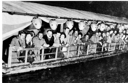
▲鶉飼を楽しむ航空教育団