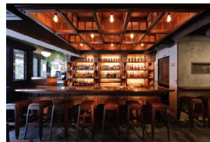
The SG Club