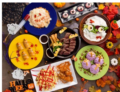
「2019 ハロウィンコース」