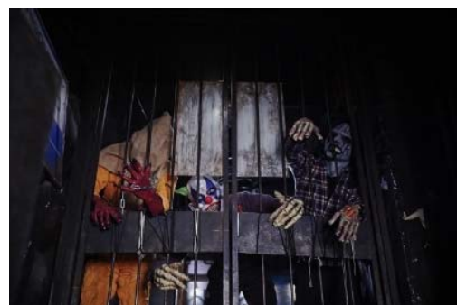
モンスターアトラクションは必見

試験管やビーカーに入った色鮮やかなドリンクやモンスターを模した料理、目玉の乗ったカクテルがインスタ映え抜群と話題沸騰の「監獄レストラン ザ・ロックアップ」。エンタメレストランの先駆け、パイオニアとして若者や海外のお客様を中心に大好評をいただいています。「監獄」をテーマにしたその店では、様々な仕掛け部屋を抜けて、やっとレストランの入口に辿り着きます。そこで「案内係」のポリスに罪を問われ、その場で「手錠」を掛けられて、薄暗い廊下を連行された先、鉄格子に囲まれた監獄個室が食事するために用意された「客席」です。お客様にはこの牢獄で食事が終わるまでは「囚人」として過ごしていただきます。自慢の食事中には、当監獄の看守長(店長)、ポリス(案内係)、模範囚(ホールスタッフ)、モンスターが素敵な「恐怖体験」でおもてなしをしてくれます。