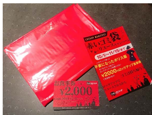
「赤いゴミ袋」リユースキャンペーン