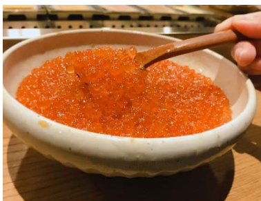
いくらかけ放題 999円