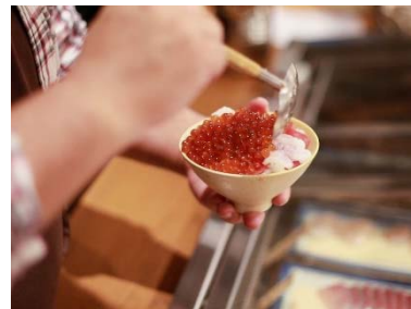
海鮮丼を自分好みカスタム

北の家族 有楽町本店では、10月26日(土)のランチタイム(11:30～14:00)より、お刺身盛り放題の「海鮮盛り放題どんぶり定食」の販売を開始いたします。金額はお一人様1,800円。ごはんの盛られたどんぶりに1回、好きなお刺身ネタを盛り放題で、自分好みの「海鮮丼」にできる、贅沢なランチ限定のどんぶり定食です。