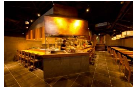
店内：ライブ感のあるカウンター