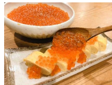
いくらを乗せた贅沢な「味変」

7月限定で開催していた「いくらかけ放題」イベントを10月21日(月)～12月8日(日)の期間限定で再開いたします。衝撃的なコスパ、お一人様999円(税別)で時間無制限、北海道産のいくらが「かけ放題」の同イベントは、いくらをそのままお酒のアテにしたり、ご飯の上に乗せてどんぶりにするスタイルはもちろんですが、自慢の料理へのトッピング(かけ放題)をおススメしています。なかでもお通し(500円(税別))で提供される茶碗蒸しや、出汁巻き玉子、じゃがいも料理へのトッピングがおススメ。いくらを乗せた贅沢な「味変」をお楽しみください。