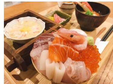
海鮮盛り放題どんぶり定食