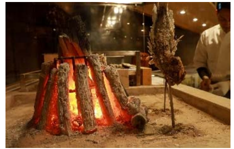
店内：原始焼きの様子

株式会社パートナーズダイニング 広報 : 設楽 電話 : 03-5332-6231 メール : m.shitara@partners-dining.co.jp