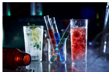
ドリンクイメージ