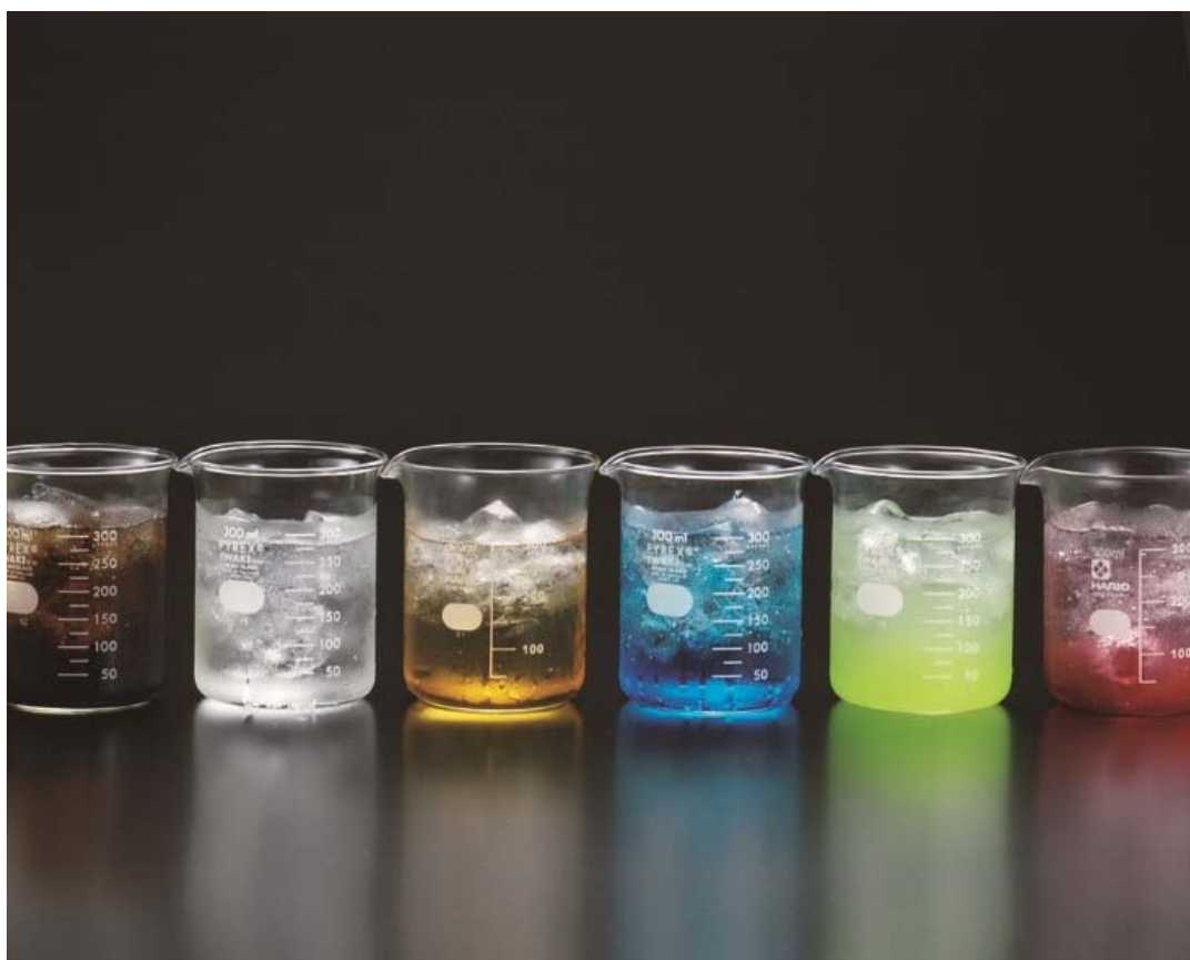
ロックアップ名物「ビーカー」で提供されるドリンク

「監獄レストラン ザ・ロックアップ」を運営する株式会社パートナーズダイニング(本社：新宿区西新宿、代表取締役社長：中村 英樹)は、OSAKA、NAGOYA の 2 店舗限定で、1998 年 4 月 2 日～1999 年 4 月 1 日の期間に生まれた、2019 年の新成人を対象に、通常 1,000 円の飲み放題が、新成人なら「20 円」になるイベントを 2 月 11 日(月)まで開催しています。