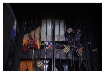
モンスターアトラクションは必見