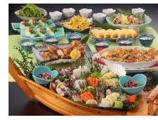
右) 【関西エリア】宴コース