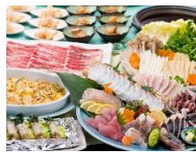
左) 【関東エリア】旬の宴 春コース