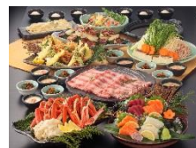
右) 【関西エリア】春の味覚コース