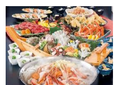
右) 【関西エリア】北の家族 豪華コース