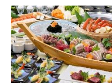
左) 【関東エリア】豪華舟盛りと山海コース