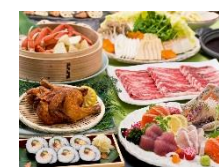
左) 【関東エリア】歓送迎会コース