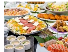
左) 【関東エリア】まるごと北海道コース