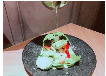
温かいソースでチョコがとけると 中からはアイスやフルーツが