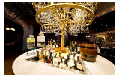
100 種類以上のワインが並ぶ 「ワインシャンデリア」でお好きなワインを