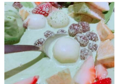
話題のタピオカ入り 白玉や餡子、抹茶アイスも