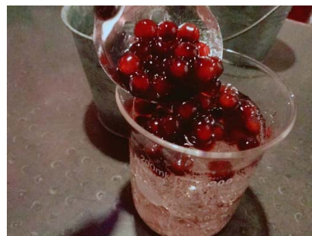
タピオカ入れ放題