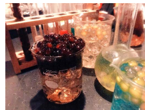
カスタム OK! 溢れるほど入れられる