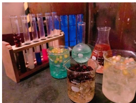
ブラック or カラフルからタピオカは選べます