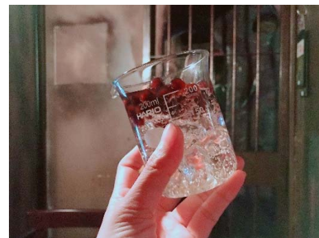
監獄風の鉄格子とピーカーが映える