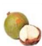
マカデミアナッツ オイル *8 (整肌成分)