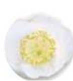
カメリア オイル *5 (エモリエント成分)