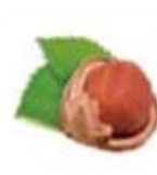
ヘーゼルナッツ オイル *7 (整肌成分)