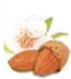
スイート アーモンド オイル *4 (整肌成分)