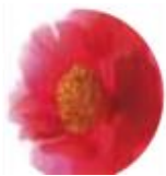
ツバキ オイル *2 (エモリエント成分)