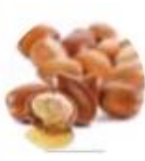
アルガン オイル *3 (エモリエント成分)