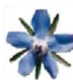
ルリジサ オイル *6 (エモリエント成分)