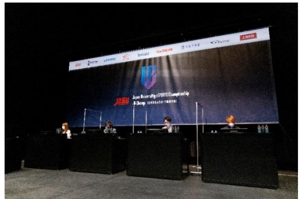
左/PUBG 優勝 kikutaka_0325 選手(北里大学)