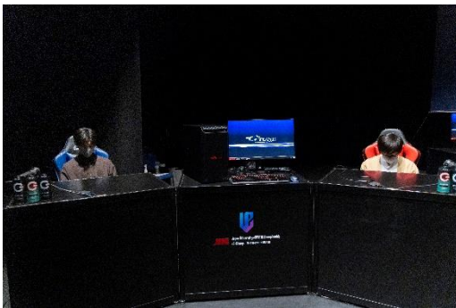
ワイレ(モバイル版)決勝大会/同表彰式