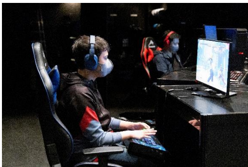
ストV 決勝大会/同表彰式