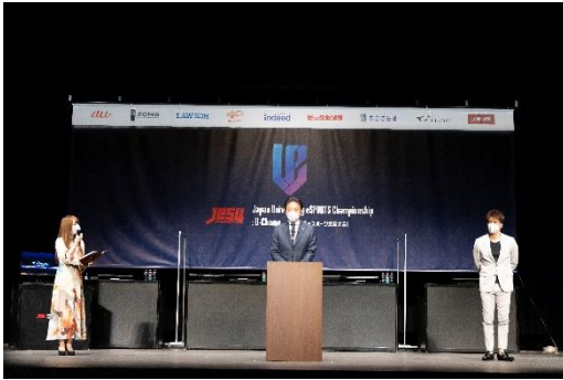
大会オープニング/PUBG 決勝大会