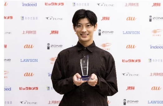
ポンジュパリピコ選手 (福岡大学)