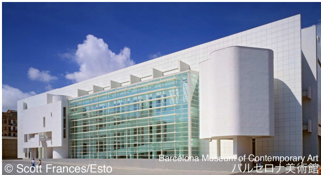
バルセロナ美術館