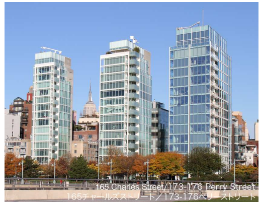
165 チャールズストリート/173-176 ペリーストリート