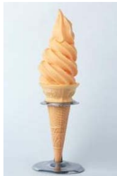
夕張メロンソフトクリーム

夕張メロン果汁たっぷり！ あったら絶対食べたくなる、小樽のソフトクリーム屋さん。