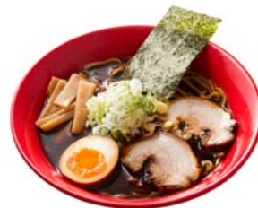
富山ブラック黒醤油らーめん

夕張メロン果汁たっぷり！ あったら絶対食べたくなる、小樽のソフトクリーム屋さん。