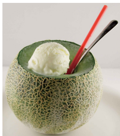
メロンまるごとクリームソーダ