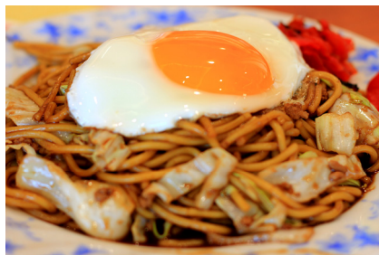
ひるぜん焼きそば