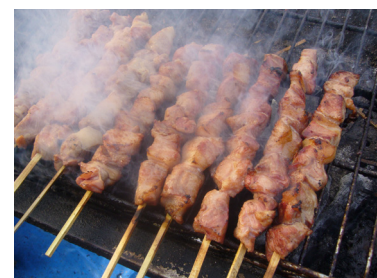
五浦ハム ハム焼き