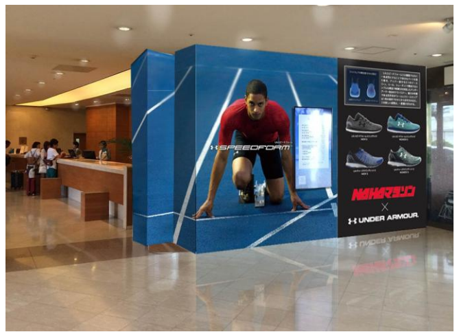
アンダーアーマー ランナーズハウス ロワジールホテル 那覇 (イメージ) ロワジールホテル 那覇エントランス (イメージ)