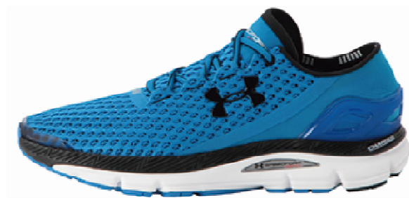
『UAスピードフォーム ジェミニ』