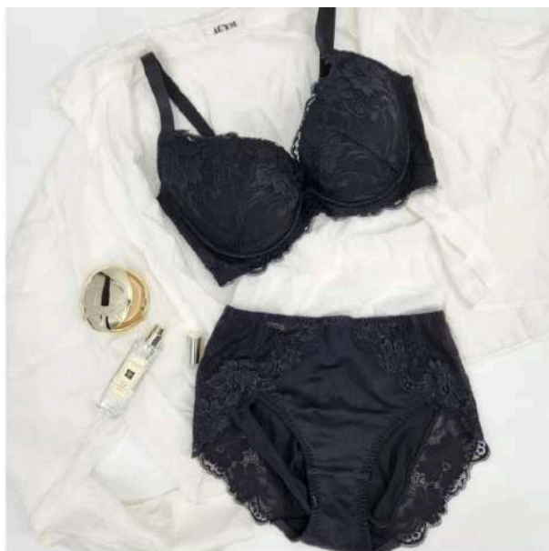
PGブラDAY ショーツセット ¥9,900(税込) Color: BLACK / WHITE / NAVY / PINK ショーツSize: M / L / LL