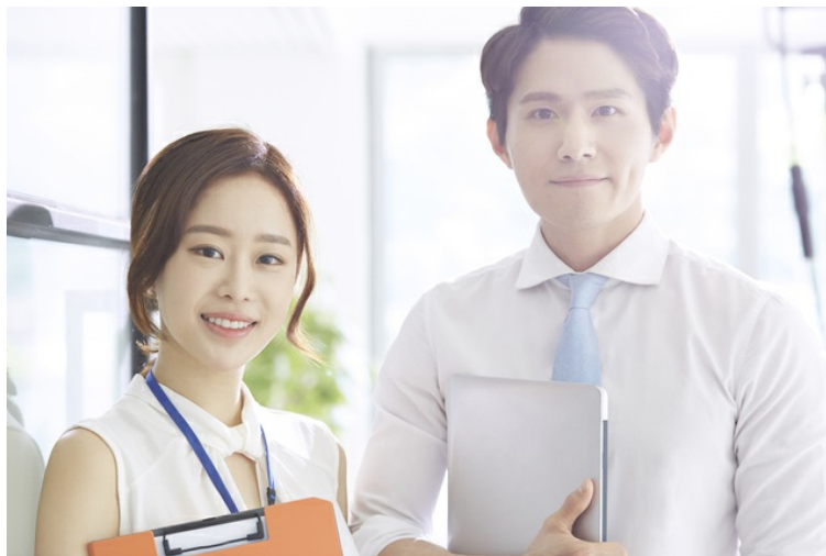
代理店様を募集しています。