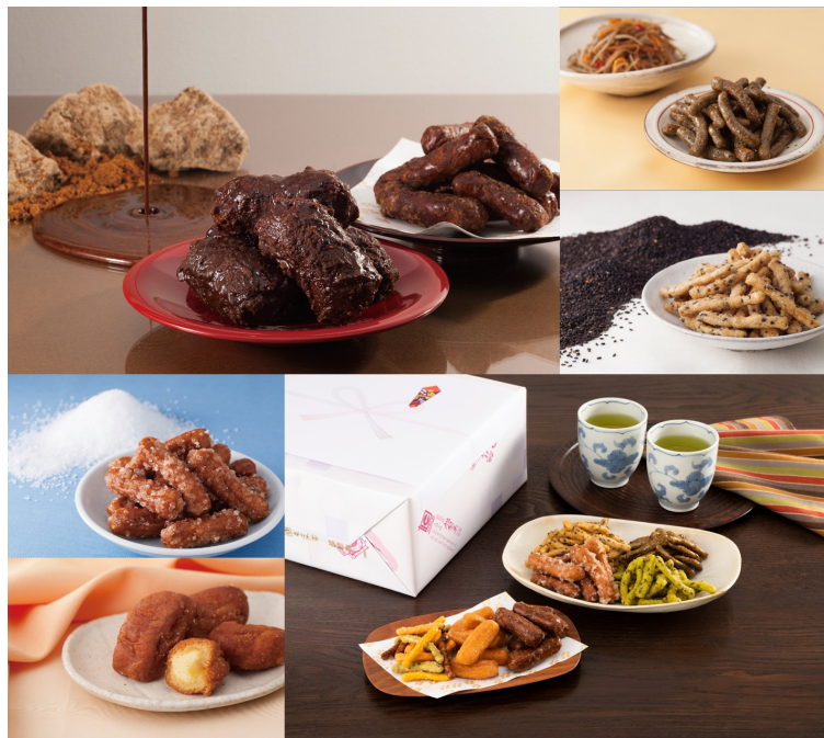
創業大正13年の『株式会社旭製菓』 西東京市

http://www.asahi-seika.co.jp/asahi-karinto.html