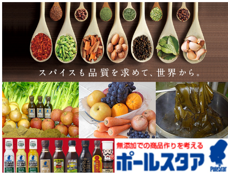
創業1850年（嘉永3年）の株式会社ポールスタア 東京都東村山市